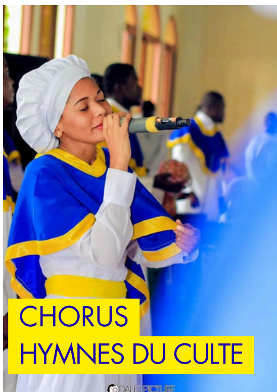
CHORUS HYMNES DU CULTE