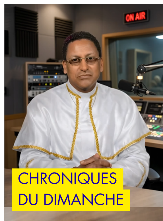
CHRONIQUES DU DIMANCHE